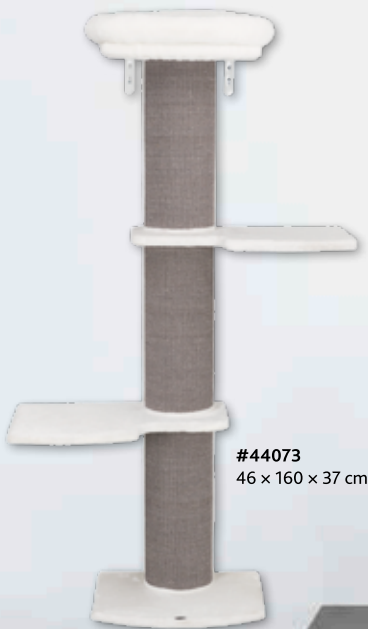
#44073 46 x 160 x 37 cm