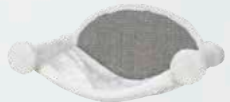
#49920 54 x 28 x 33 cm