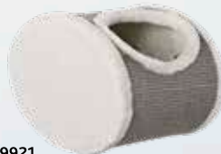
#49921 42 x 29 x 28 cm