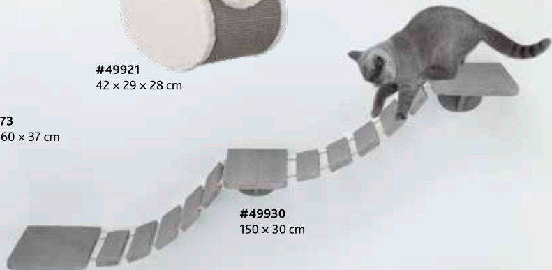
#49930 150 x 30 cm